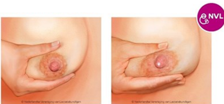
Afbeelding 2 en 3