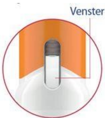
Afbeelding 2: venster van de Pegfilgrastim injector