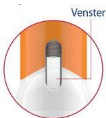
Afbeelding 2: venster van de Pegfilgrastim injector