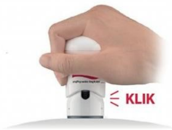
Afbeelding 4: prikken | Afbeelding 5: 5 seconden wachten na de klik