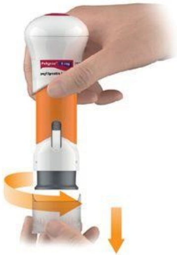
Afbeelding 3: draai de dop van de injector